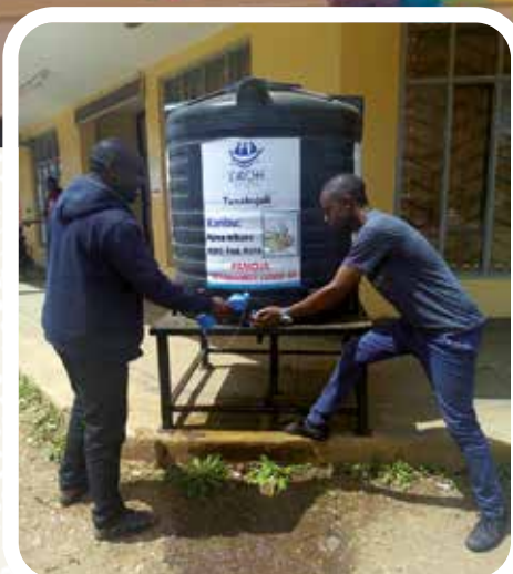
L'Arche au Kenya

L'objectif est d'informer sur les dangers du coronavirus et rappeler les gestes barrières pour se protéger au mieux. Par ailleurs, des personnes en situation de handicap et des assistants ont installé des bonbonnes d'eau dans les rues de Nyahururu pour inciter la population à se laver