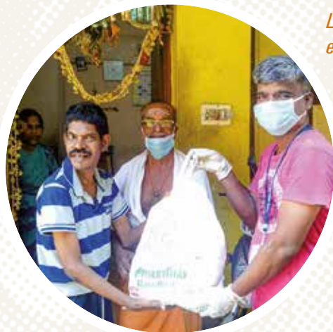
L'Arche en Inde

Durant le confinement des arcs-en-ciel ont jailli un peu partout dans les communautés de L'Arche. Celui de Marguerite nous rassure : « Tout ira bien ». Accrochés aux fenêtres des foyers ou postés sur les réseaux sociaux, ces arcs-en-ciel incarnent une espérance en un avenir meilleur. Ils expriment aussi la gratitude des membres de L'Arche envers ceux qui luttent en première ligne contre le coronavirus, notamment les soignants.